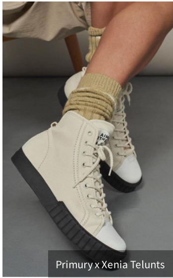
Primury x Xenia Telunts