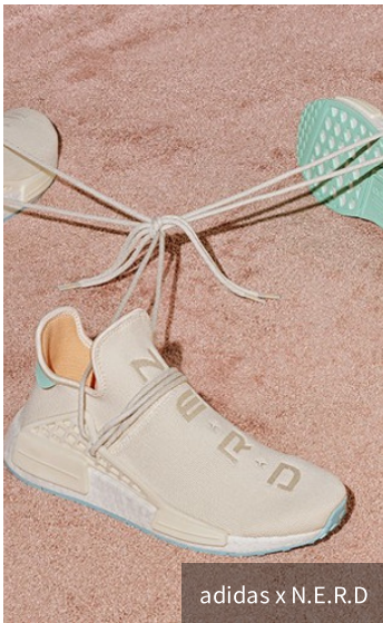
adidas x N.E.R.D