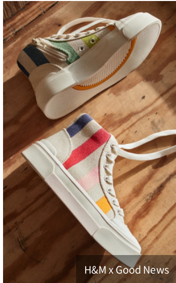
H&M x Good News