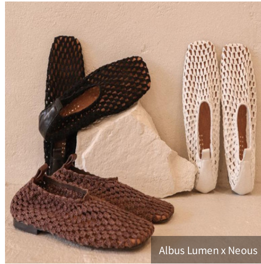
Albus Lumen x Neous