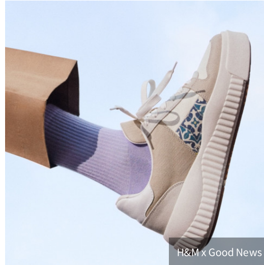
H&M x Good News