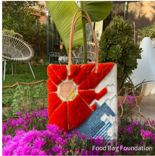
Food Bag Foundation