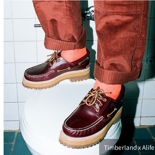
Timberland x Alife