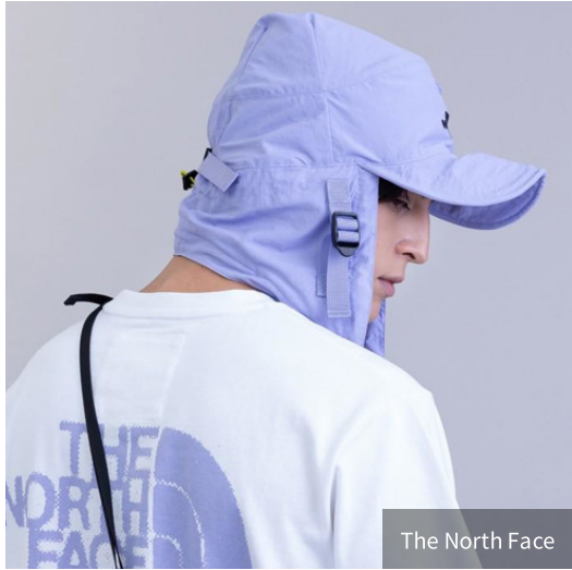
The North Face