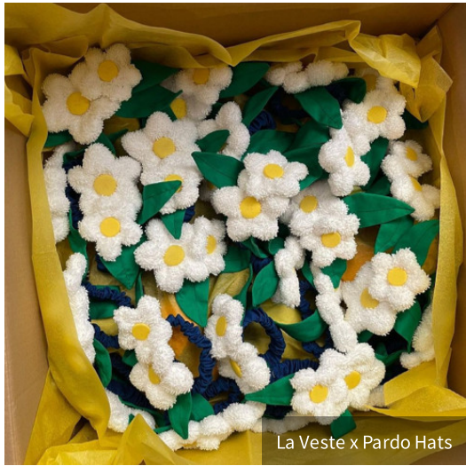
La Veste x Pardo Hats