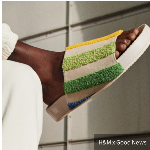
H&M x Good News